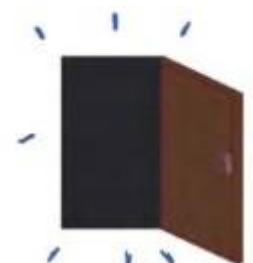
no not any